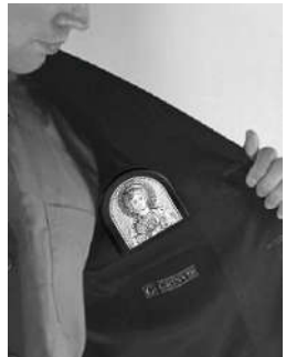
Дорожная икона для женщины в сумочку