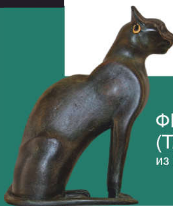
ФИГУРКИ ЖИВОТНЫХ (ТАЛИСМАНЫ)