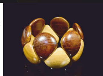
БРАСЛЕТ ИЗ ДЕРЕВА