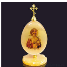
ЯЙЦО ИЗ СЕЛЕНИТА НА ПОДСТАВКЕ С КРЕСТОМ