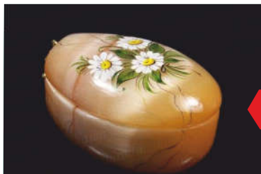
ШКАТУЛКА ИЗ СЕЛЕНИТА С РОСПИСЬЮ