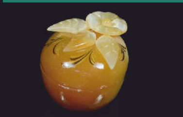
ШКАТУЛКА ИЗ СЕЛЕНИТА